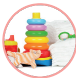
Univers du Bébé