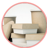
Contact alimentaire & packaging