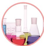
Chimie, Biocide & Phyto