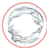
Eau & environnement