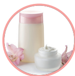
Cosmétique & bien-être

Afin de prendre en compte l'ensemble des voies de signalisation endocriniennes et pas seulement au niveau de la cellule